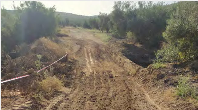
Camino San José.