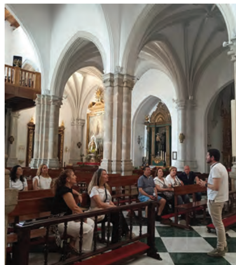
Cartel de promoción de la feria

Asimismo, esto se ha traducido en una mayor profesionalización del sector turístico en Arjona. Más actualización y más servicio casi personalizado han hecho que el visitante se enamore de la ciudad por sus bondades y por sus oportunidades.