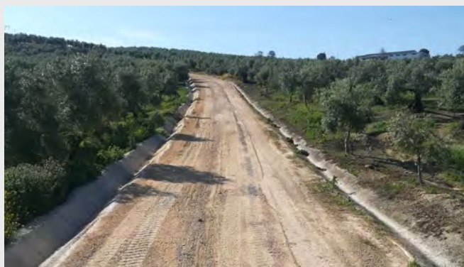
Huerta El Picaor.