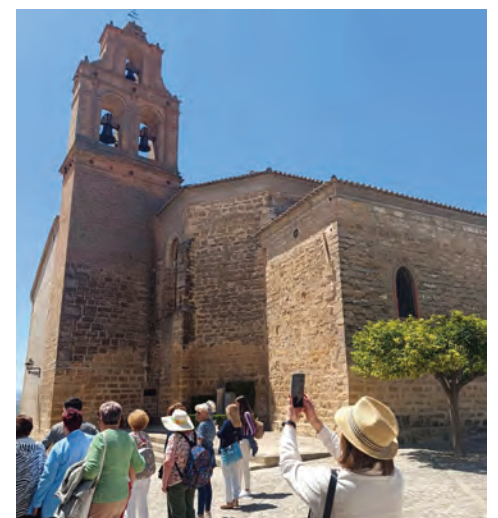
Cartel de promoción de la feria