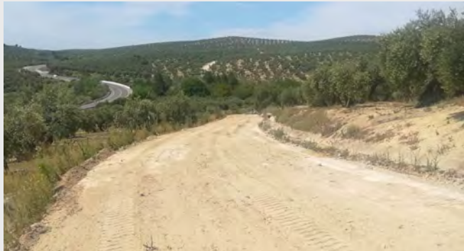
Camino La Colosa.