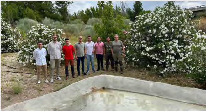
Visita técnica a una de las pozas.

Cuidamos los caminos rurales de la ciudad, modernizándolos para mayor comodidad y seguridad. Además, limpiamos los pozos para garantizar el acceso a un agua de calidad y protegemos el olivar, motor económico de la zona. El bienestar animal también es nuestra prioridad, con iniciativas que promueven su cuidado.