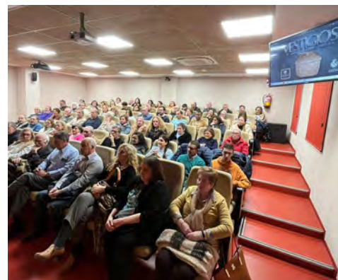
Presentación de 'Vestigios' en la UJA.

Apoyar y desarrollar la cultura arjonera supone de forma indirecta apoyar al comercio de la ciudad. Por ello, hemos organizado Feria de Catas de Aceite , en la que se ha permitido promocionar el aceite de oliva local, apoyar a los productores y dinamizar la economía. Otra acción donde pusimos de manifiesto nuestro compromiso con los empresarios de Arjona fue con la celebración de la